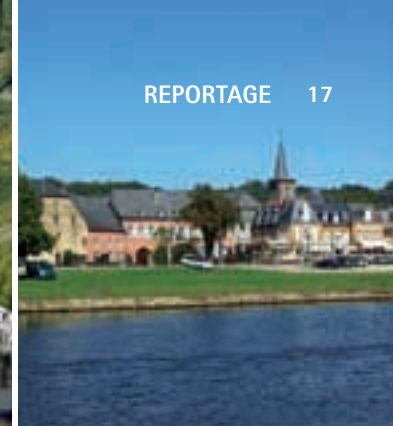
Schön aber unerreichbar: Der hübsche Ort Ehnen (oben) hat keine Anlegestelle. Unten: Abendstimmung in Remich.

Start und Ziel: Sierck-les-Bains mit seiner malerischen Festungsanlage.