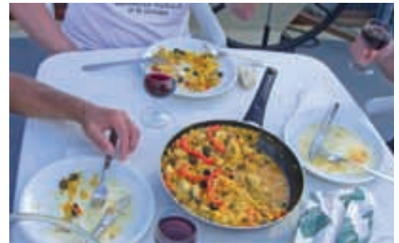
Remich: Applaus für die Paella des Bord-Bocuse

Frage: Wie groß muss eine Küche sein, in der eine Paella für sechs Personen zubereitet werden kann? Die Antwort: Nicht größer als die Kombüse einer Kormoran mit ihrem vierflamigen Gasherd. Die zwei Pfannen, die Bocuse von Jürgen und Dieter auf das Sonnendeck schleppen lässt, bringt Spaziergänger zum Klatschen. Nicht alles, was uns an Lob zu Ohren kommt, verstehen wir, denn das Luxemburgisch, „Lëtzebuergesch“ genannt, ist eine Sprache für sich. „Wenn wir die Paella ordentlich begießen“, schlägt Kurt vor, „verstehen wir die Leute besser.“ Alles klar, Proscht!