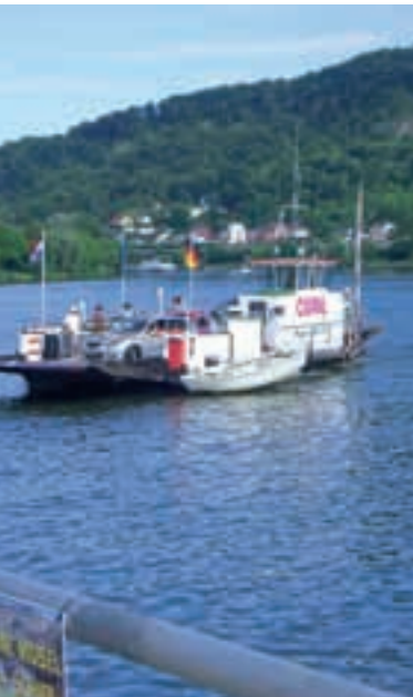
Abkürzung übers Wasser: Die Fähre Oberbillig-Wasserbillig (oben) verbindet Deutschland mit Luxemburg. Später kann sich auch Andreas, genannt Bocuse, gemütlich zurücklehnen.