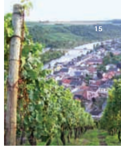
Elder Blick: Vom Koepppen, der teuersten Weinsteillage Luxemburgs, gibt es gute Aussichten nach Wormeldange (oben).

Wir genießen ein Reben- säftchen, Bocuse zaubert unter Deck.