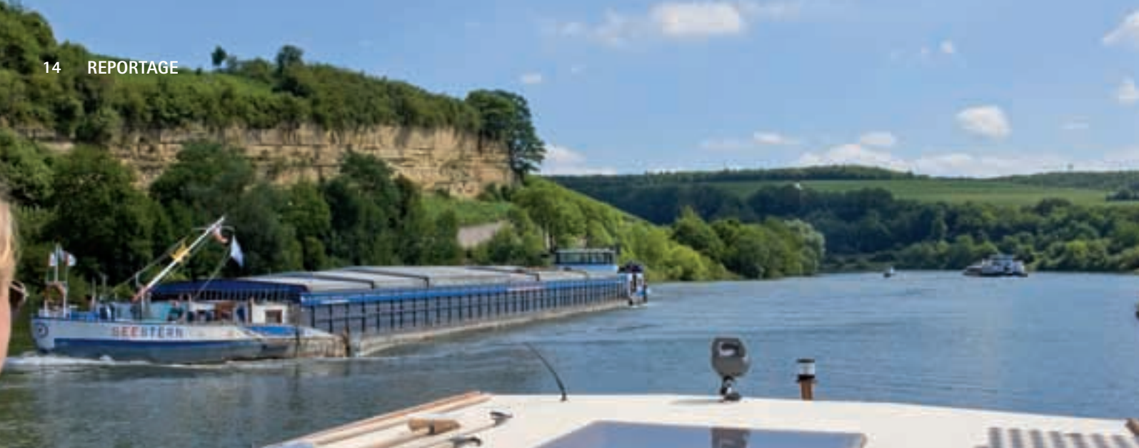
Gewaltige Aussichten: Die Muschelkalkwände bei Nittel imponieren genauso wie die Begegnung mit Frachtschiffen.