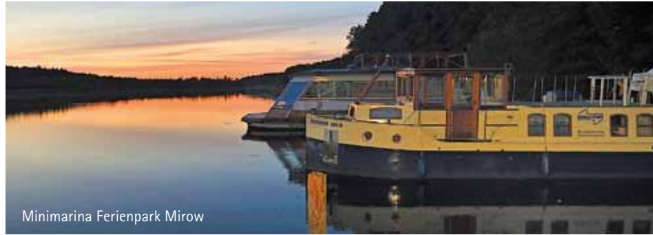
Minimarina Ferienpark Mirow

Ampel die Wende überlebt hat – weist hier aber stets den richtigen Weg. Die Kleinseen bestehen im Wesentlichen aus zwei Wasserstraßen: Die Müritz-Havel-Wasserstraße führt von der Müritz nach Priepert, die Obere Havel-Wasserstraße führt von Neustrelitz über Priepert nach Liebenwalde im Norden Berlins. Aber vorher kann man jede Menge lohnende Abstecher von der Hauptroute machen, zum Beispiel in die Rheinsberger, Lychener, Templiner und Wentow Gewässer.