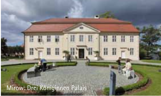
Mirow: Drei Königinnen Palais